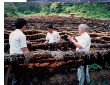
Anbau auf schattigen Feldern