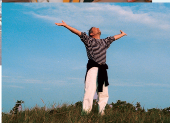
Ginseng stärkt bei körperlichen und geistigen Anforderungen