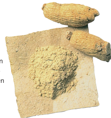
Wurzelpulver – die Basis für unsere Wurzelpulver-Kapseln und Tabletten

Um die wertvollen, biologischen Wirksubstanzen des roten Ginsengs haltbar zu machen, werden die ungeschälten Ginsengwurzeln nach der Ernte schonend gedämpft, wodurch sie ihre rötliche Tönung erhalten. Dieses Dämpfungsverfahren diente ursprünglich der natürlichen Konservierung der Ginsengwurzeln. Heute weiß man, dass dieser biologisch enzymatische Prozess die Wurzel für die pharmakologische Anwendung noch wertvoller macht.