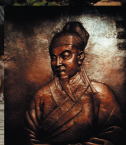
Sun Simiao – Arzt und Heilkundiger (581-682)